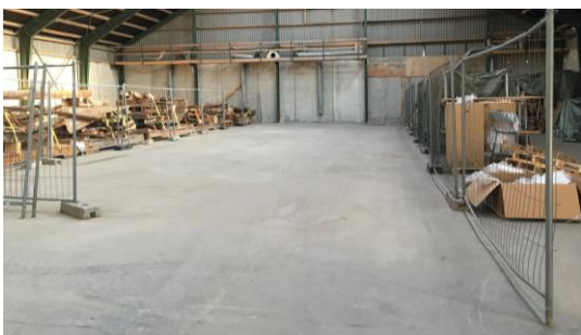
Fotoaf lignende lager