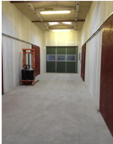
Lager fælles gang 5 lejemål