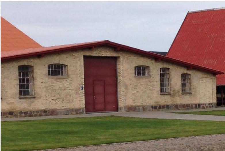
Lager udefra via fællesport.