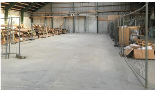
Foto aflignende lager